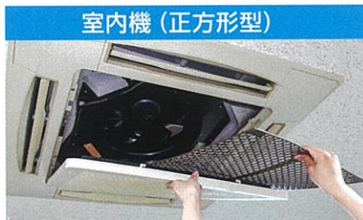
そのままフィルターのの上に敷く