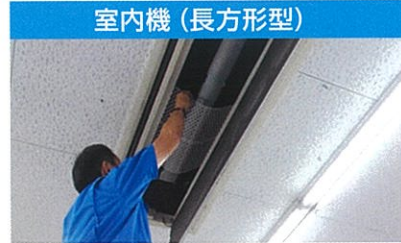
フィルターの大きさにカットして、 できるだけフィルターの上に置く