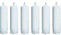
※50kg容器の場合は6本以上