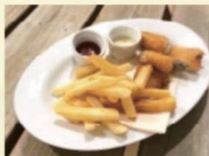
フィッシュアンドチップス 税別 480円