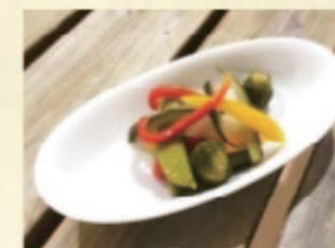
自家製ピクルス 税別 450円