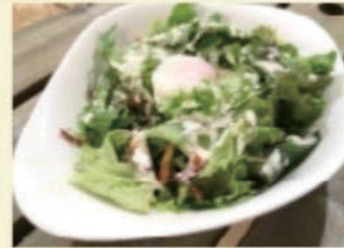
シーザーサラダ 税別 900円