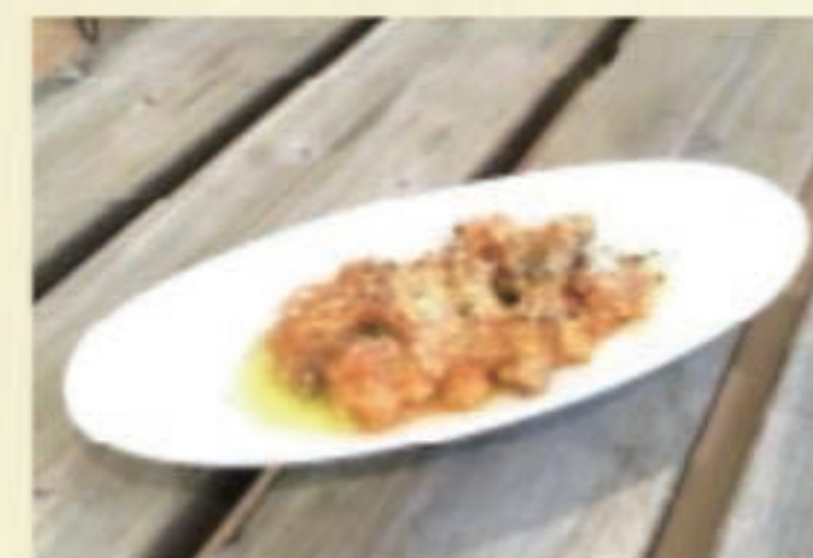
ホルモンのトマト煮 税別 400円