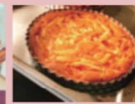
気まぐれ窯焼きタルト 種類はお尋ねください サクッとあったかいタルト 税別 1ピース 400円