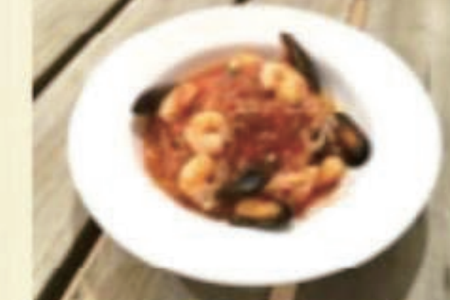
ベスカトーレ 税別1200円