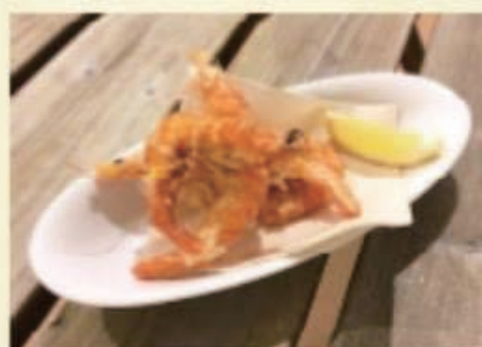
海老のフリット 税別 650円