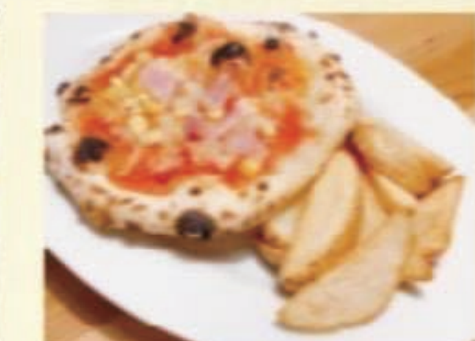
キッズプレート 税別500円