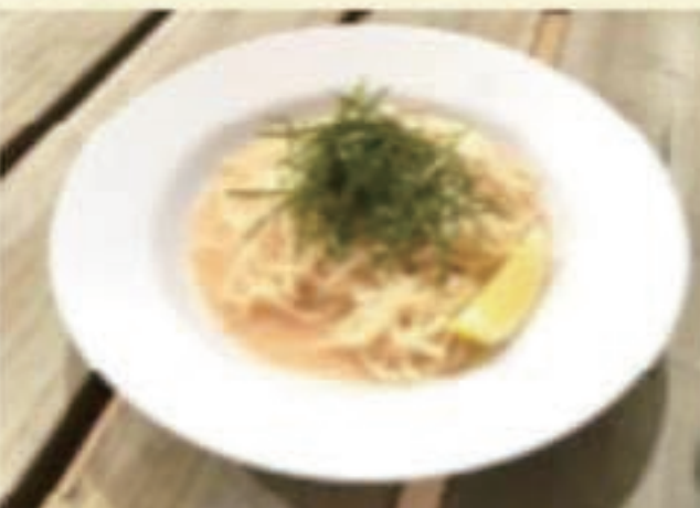
タラコとウニ 税別900円