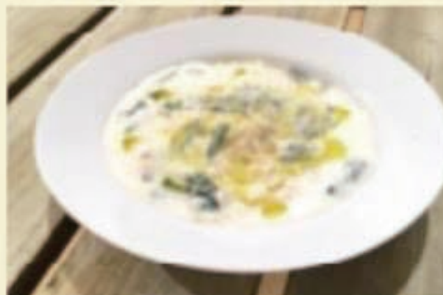
カニのホワイトソース 税別1000円