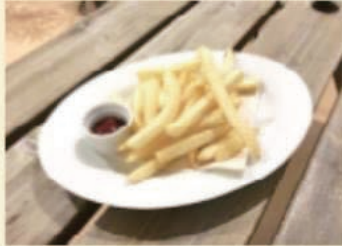
ポテトフリット 税別 500円