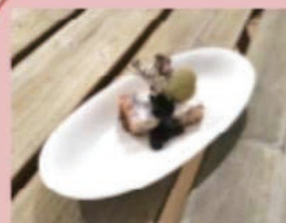
チーズケーキ 税別600円