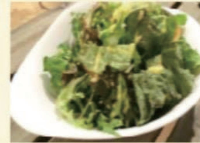
グリーンサラダ 税別 600円