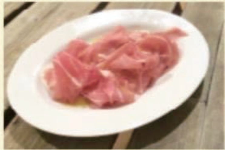
バルマ産生ハム 税別 700円