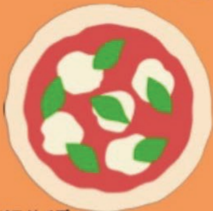
廣ペコサイズ レギュラー (約30cm)