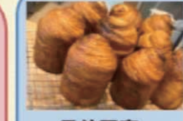
予約限定 塩パン 税別200円