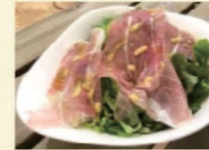
生ハムサラダ 税別 1000円