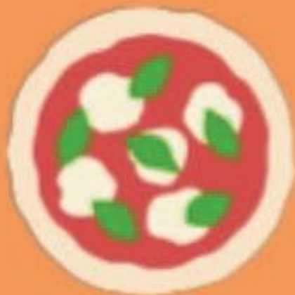
ちよいペコサイズ ミニ (約18cm)