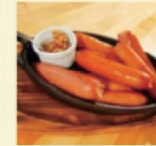
窯焼きソーセージ 税別 660円