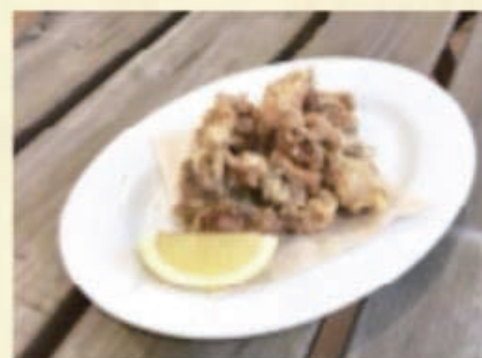
チキンフリット 税別 500円