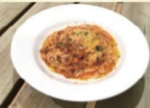
クリームミートソース 税別1100円