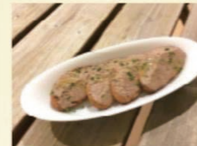
クロスティーニ 税別 600円