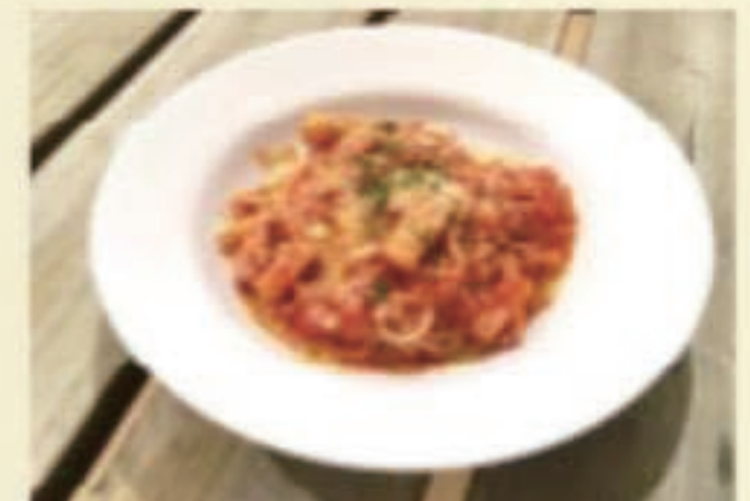
アマトリチャーナ 税別1000円